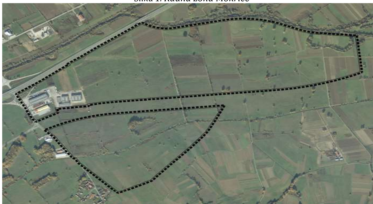
Slika 1. Radna zona Mokrice

Na području Grada Oroslavja nalazi se Radna zona Mokrice, koje je smještena u Mokricama, nadomak autoceste Zagreb–Macelj i nove prometnice brze ceste koja povezuje Oroslavje s državnom cestom prema Zlatar Bistrici, Mariji Bistrici te s autocestom Zagreb–Varaždin. Ukupna površina zone je 120.000 m 2 . Razvoj radne zone Mokrice usmjeren je kao malo razvojno središte te kao takvo, ima ulogu generatora razvoja u Gradu. Položaj na križanju važnih državnih cestovnih pravaca i neposredna blizina Grada Zagreba također pogoduje razvoju ovog dijela naselja. Ovako dobra prometna povezanost s ostatkom županije i države zasigurno pruža vrlo dobre preduvjete za razvoj radne zone.