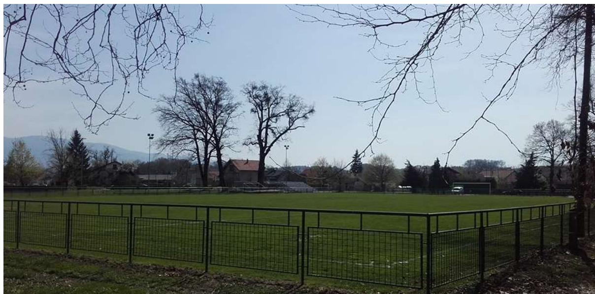
Slika 2. Nogometno igralište Oroslavje

Lokalne jedinice, u propisanim okvirima, samostalno određuju pravila i procedure upravljanja i raspolaganja vlastitom imovinom, odnosno nogometnim stadionima i igralištima. Način, ovlasti, procedure i kriteriji za upravljanje i raspolaganje mogu se utvrditi unutarnjim aktima.